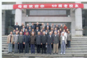
59届校友返校聚会合影