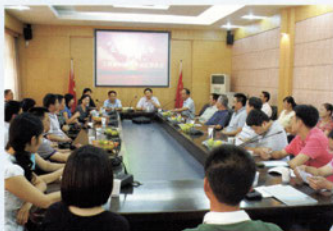
工民建95级同学返校座谈会 ←