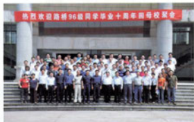
路桥96级同学会返校聚会合影