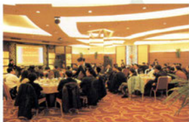
天津校友会新春联谊会