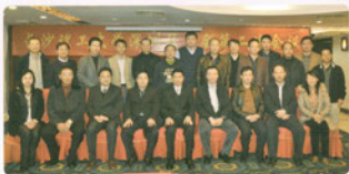
王耀中书记等参加深圳校友会换届大会并看望校友