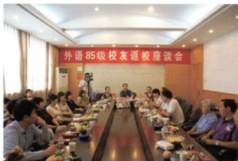
← 外语85级校友返校座谈会