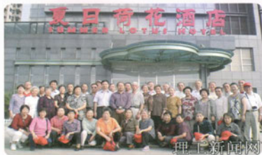
▶ 2009年十月间，在举国欢庆喜迎建国六十周年之际，我校（原交通部长沙航务工程学校）59届50多位老校友欢聚天津，举办毕业50周年纪念活动。