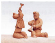
肖小裘雕塑作品赏析