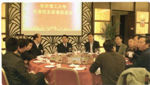
王耀中书记等参加天津校友新春联谊会并看望校友