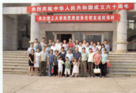
工民建95级同学返校聚会合影